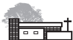
CAPPELLA DEL PELLEGRINO 2000